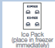
Ice Pack (place in freezer immediately)