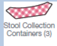
Stool Collection Containers (3)

שלושה סוגים של שקיות איסוף דגימות צואה כמותואר מטה במיכלים ייעודיים לפי ימי איסוף רלוונטיים (פקקים שחורים, פקק צהוב ופקק לבן):